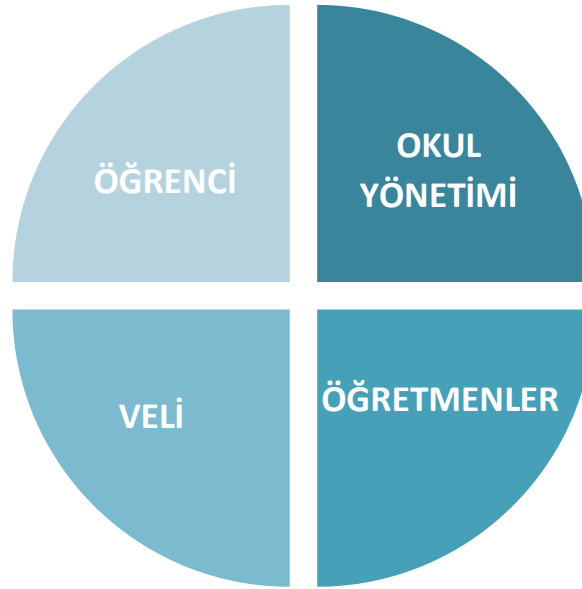
Şekil 1: Okul Temel Paydaşları

Stratejik Planlama sürecinde katılımcılığa önem veren kurumumuz tüm paydaşların görüş, talep, öneri ve desteklerinin stratejik planlama sürecine dâhil edilmesini hedeflemiştir. Bu kapsamda İlkadım İlkokulu, faaliyetleriyle ilgili sunulan hizmetlere ilişkin memnuniyetlerin saptanması, kuruma ilişkin beklentiler, kuruma ilişkin durum tespiti, kurumsal iş birliği ve eşgüdüm, GZFT, önerilerin tespiti vb. konular hakkında İlkadım İlkokulu Stratejik Planlama Ekibi ile toplantılar düzenlenmiş ve kurumumuzun temel paydaşları olan öğrenci, veli ve öğretmenlerin görüş ve önerilerini almak üzere görüşme ve anket yöntemi uygulanmıştır.